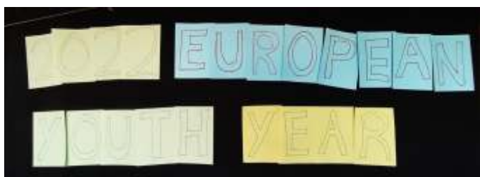
2022 het Europees jaar van de jeugd

Aankomende zomer vindt in Mery-sur-Oise een grote Europese jongerenbijeenkomst van ATD Vierde Wereld plaats. Ter voorbereiding zijn we van 3 tot 6 maart bijeengekomen in Wijhe, samen met zo'n 35 jongeren uit Spanje, Polen, Frankrijk, Ierland, België, Luxemburg en Nederland.