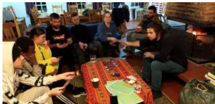
Kennis maken informeel

De eerste ochtend ging van start met kennismakingsspelletjes, dit voelt altijd wat onwennig aan in het begin, maar het wordt al snel lachen geblazen!