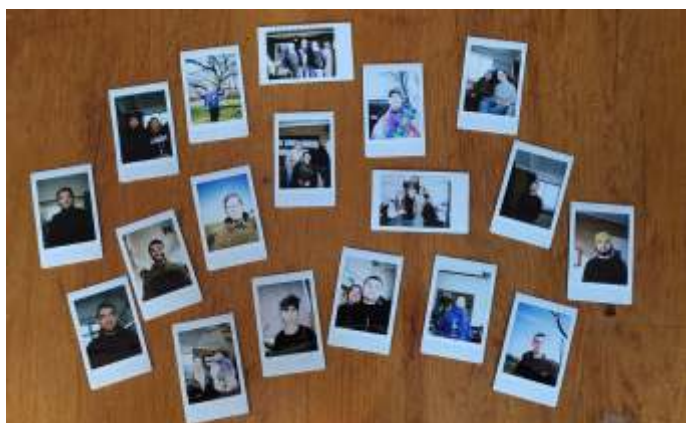
Kennis maken middels foto's

Na een lange dag werken en aansluitend een lange reis was het een zeer fijn weerzien van bekende gezichten. Ook de kennismaking met nieuwe gezichten verliep zeer aangenaam!