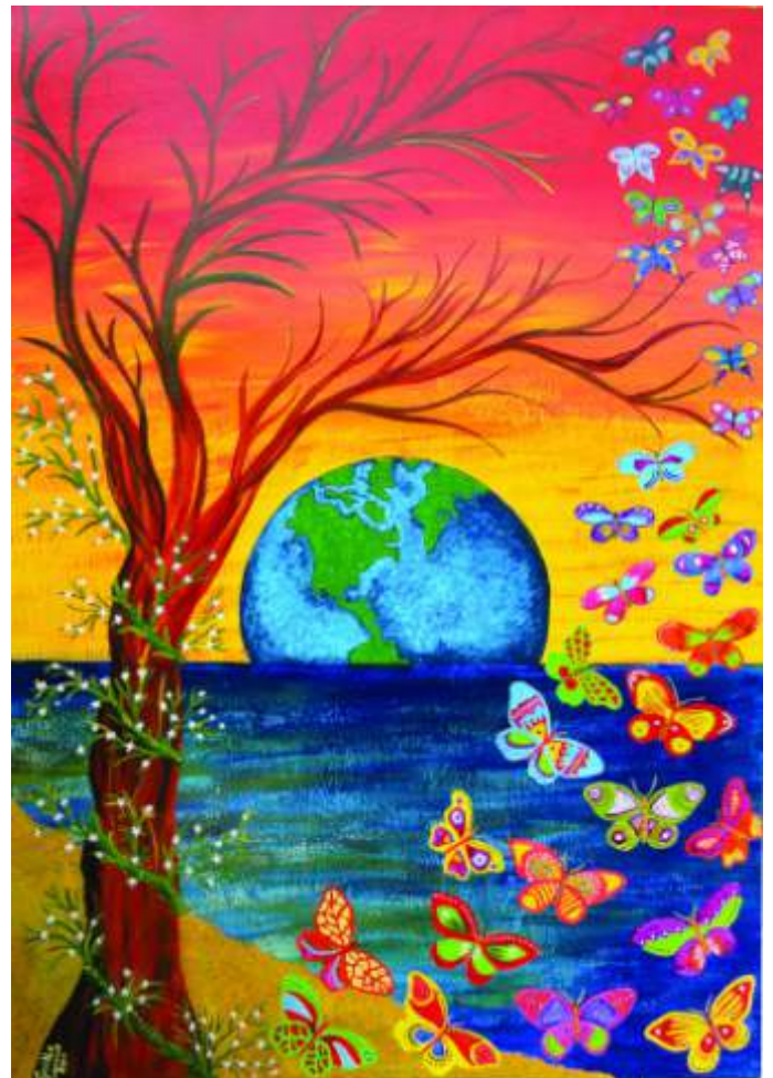
La Esperanza (Hope), 2011