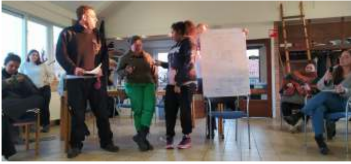
Presenteren wat in kleine groepjes was voorbereid

"Jonge mensen die een moeilijk leven hebben en het willen veranderen, het woord is aan jullie!"