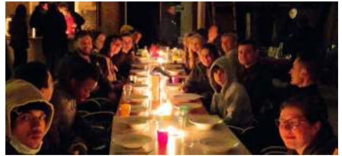
Eten bij kaarslicht

Zaterdagavond was Freetime maar tijdens de bereiding van het avondmaal was de electriciteit uitgevallen, wat het koken wel wat bemoeilijkte. Wij vonden het uiteindelijk zeker wel wat hebben, eten bij kaarslicht!